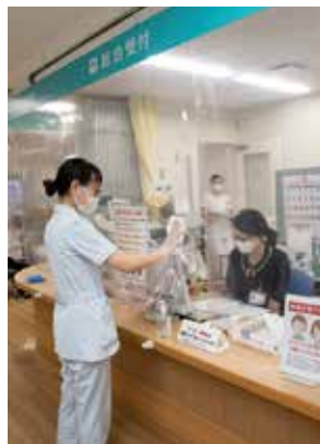
▲受付周りの透明シートの清掃