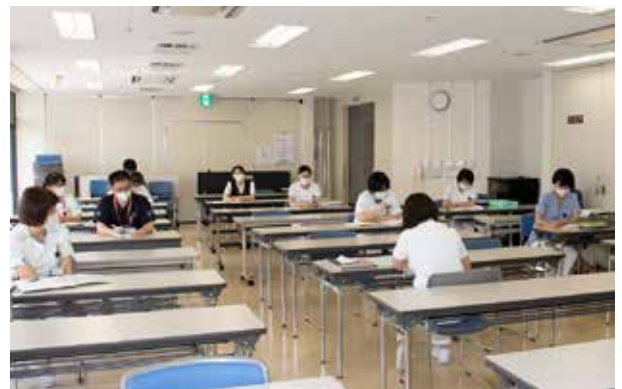
▲コロナ感染対策ミーティング、ソーシャルディスタンスを保って