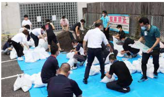
▲マスク着用だったため総勢30名、汗だくでの作業でした