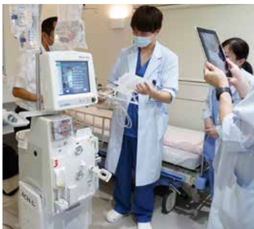
▲ACE（急性期クリニカルエンジニア）チームの操作勉強会