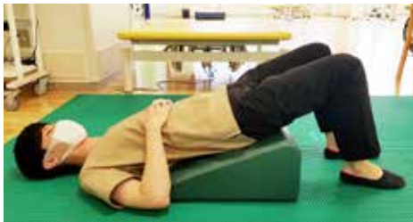
▲ブリッジ(腰上げ)姿勢

や Pubmed で読んでいただきたいですが、要約すると座位、仰臥位、ブリッジ姿勢での嚥下時における食道蠕動がどう変化するかを検討した論文です。ブリッジといっても腰の下に敷くクッションがあれば、簡単に施行できる姿勢です。