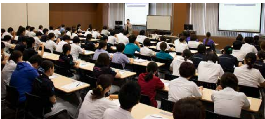
▲評価者研修 基礎編 28名・応用編 191名、被評価者研修に80名の出席が