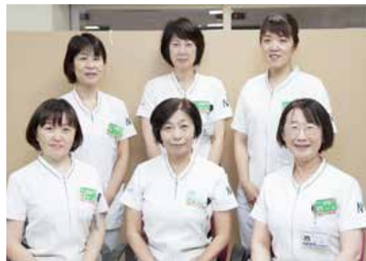
▲災害支援ナース。後列左端筆者

日本看護協会では、大規模災害発生時に被災地支援を行う「災害支援ナース」活動を行っており、全国で9,413名（平成30年3月）が登録しています。その「災害支援ナース」とは別に高知県看護協会では、南海トラフ地震などで地域が孤立し支援が遅れることを想定し、「県下で災害が発生し所属機関に着任できない場合に、最寄の救護病院、救護所等で支援を行う」ナースとして高知県独自の「地域災害支援ナース」を育成