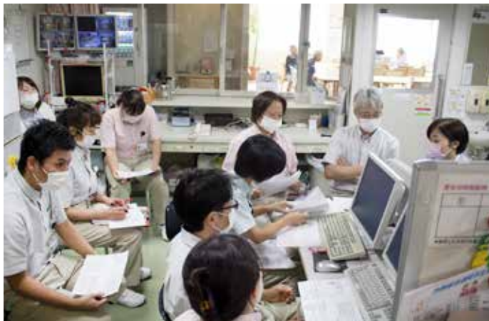
▼病棟の感染対策勉強会に参加

感染管理認定看護師は、直接患者さんにかかわることは少なく、職員の方々に協力していただく対応がほとんどです。これからも患者さんに安心、安全に医療・看護が提供できるよう皆様のご協力を得ながら、感