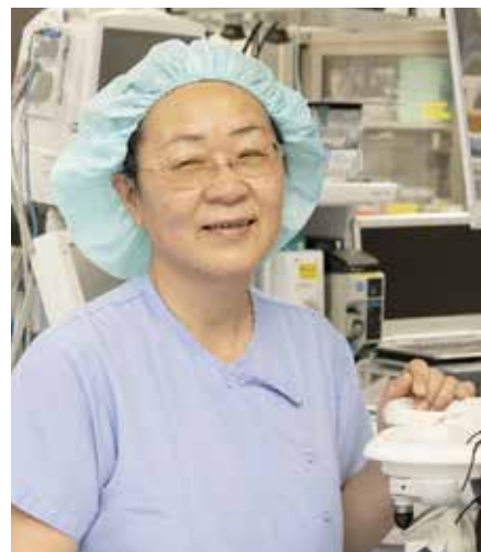
▲職場では「ほぼほぼの仕事着です!」