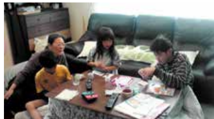
▲「これから孫たちにお年玉です(笑)」