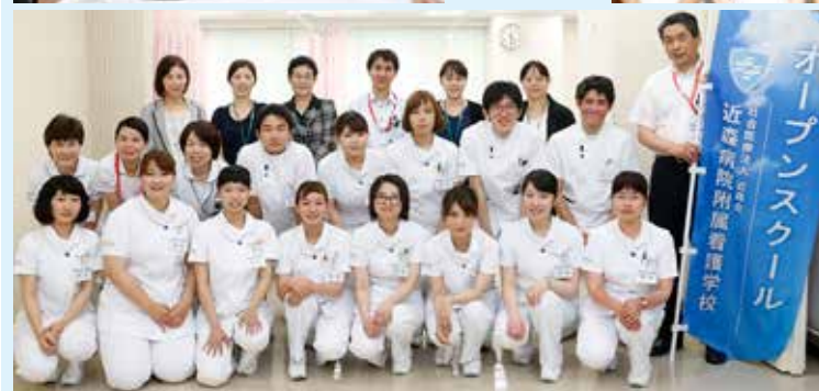
◀大勢の学生スタッフが支えてくれました