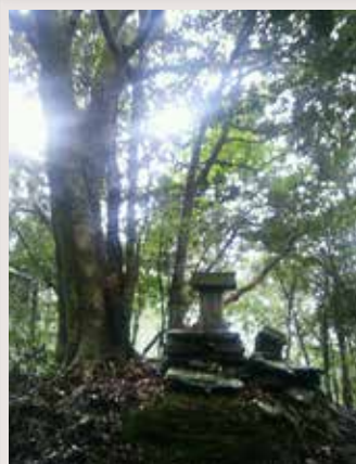
◀故郷の小さな祠 ▼晩春に咲くユキモチ草