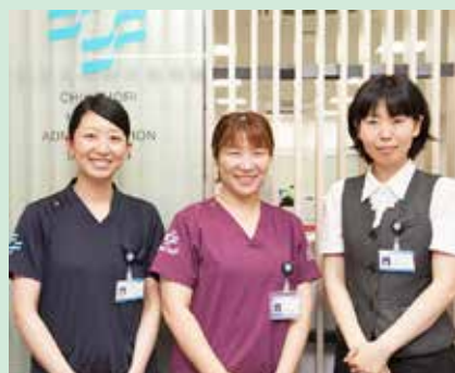
▲ PS 通信編集チームは私たち