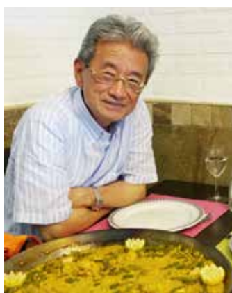
パエリアの大きなお皿を囲んで