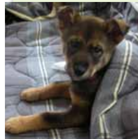
▼よくコタツで丸くなっていた子犬のアンコ

愛犬「アンコ」(♀3才)がひろつぱに登場するのは実は二度目なんです。一度目は269号(2008.12)の「飼い主募集中」の記事で、お母さん犬のおっぱいを一生懸命飲んで五匹のうちの一匹です。この記事がきっかけで我が家の三代目ワンコとして家族の一員となりました。