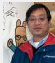
JR土佐山田駅構内にある香美市いんふおめーしょんで

1959年土佐山田町生まれ。大学卒業後、専門紙記者、代議士秘書、地方テレビ局、団体役員等を経て、2009年香美市地域雇用創造協議会設立とともに現職。香美市の観光や地場産業の振興を通じた町づくりに携わる。