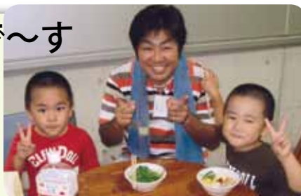
今夏の一日、仲良しの企業の地産地消行事に息子ふたりと参加した

人が大勢集まる施設(近森病院外来センター)が隣りにオープンしたことを新たなビジネスチャンスにしたいと、三代目の若旦那さんはいま寝る間も惜しむ勢いで、プランを練っている。従来の「旅行」を膨らませて、メディカル(医療)ツアーと呼べるような「健診目的の宿泊プラン」や、「栄養士の献立による美食プラン」など次々目新しいツアー企画を編み出し、近森会の患者さんやご家族を中心に、広く一般のお客さんや近森会スタッフにまで範囲を拡げて提案していきたいのだそうだ。