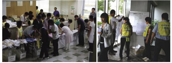
急な大雨で受付大慌て

なかったことで、災害時活動の意識づけができ「各自の防災訓練となった」のは良かった。これを活かし、活動マニュアルの充実をはかり、来年もより実践的な防災訓練を行いたいと考えている。