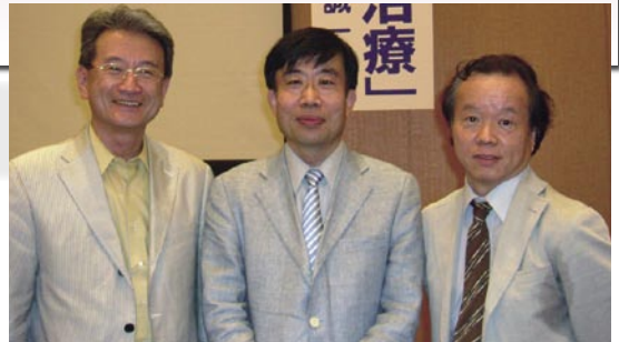
▼当日、好評を博した一枚。さてこの面々は？(正解は8面に♡)

最後に当日、最も好評だった写真▶を提示します。過ぎ去りし70年代を感じて下さい。