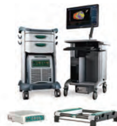
3Dマッピングシステム ▲ (EnSite NavX, Abobott 社提供)

また、最新の3Dマッピングシステム (EnSite NavX, CARTO 3) と心臓電気生理ラボ装置 (RMC-5000, 日本光電) を用いており、心房頻拍、心室性頻拍等の難治性不整脈に対してもアブレーションを行っておりますので、不整脈でお困りの患者様がおられましたら、御紹介いただければ幸甚に存じます。